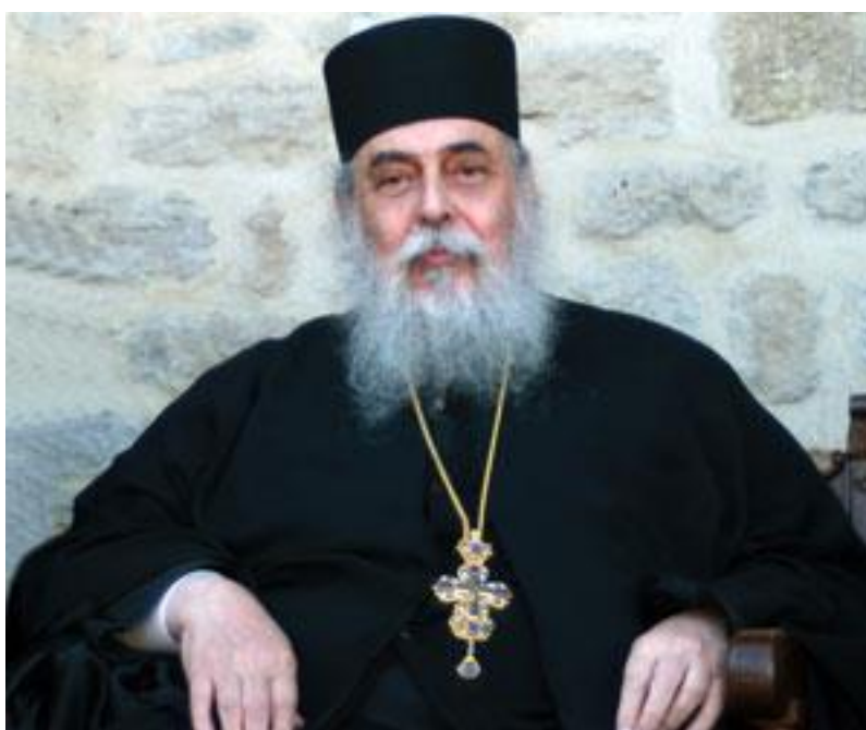
Monastýr sv. Řehoře na Svaté Hoře Athos

V Bohu zesnulého igumena Posvátného monastýru sv. Řehoře na Svaté Hoře Athos