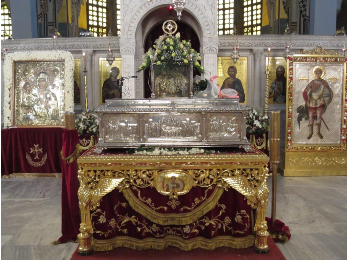
Hrob (larnaka) s myrotočivými ostatky sv. muč. Dimitra

Starec Georgios Grigoriatský se vyznává ze své lásky ke sv. Dimitriovi, která je vlastní všem „Svatohorcům“, neboť Svatá Hora je doslova „sousedem“ města Soluně a vždy měla velmi úzké vazby s tímto městem. Byly doby, kdy Svatohorští otcové byli rukopokládáni za biskupy města Soluně stejně jako i svatý Řehoř Palama, svatý Theonas a mnozí další.