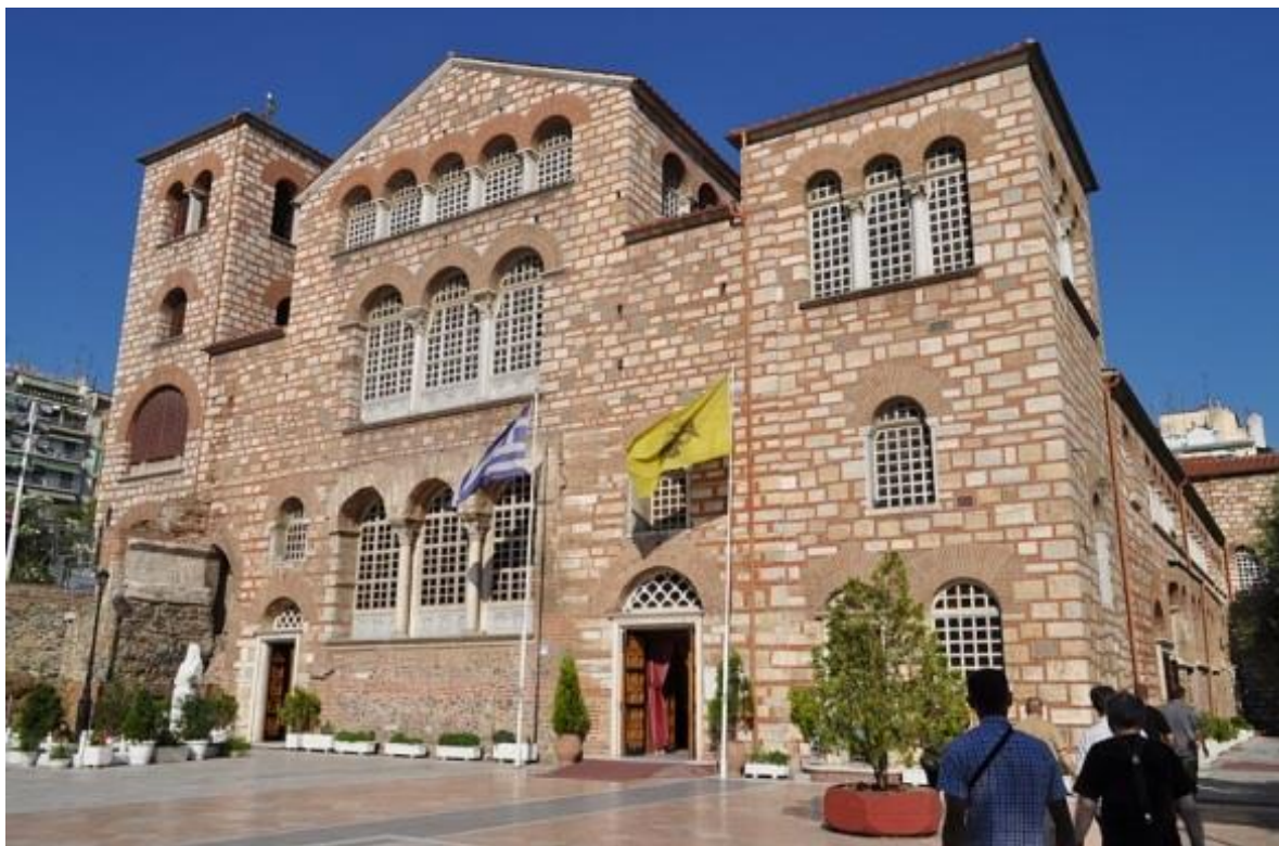
Chrám sv. mučedníka Dimitria v Soluni

církevní obce v Soluni, kterou opakovaně zachránil před různými nebezpečnostmi, jak tomu bylo i naposledy v roce 1912 při válečných událostech, které se tehdy udály.