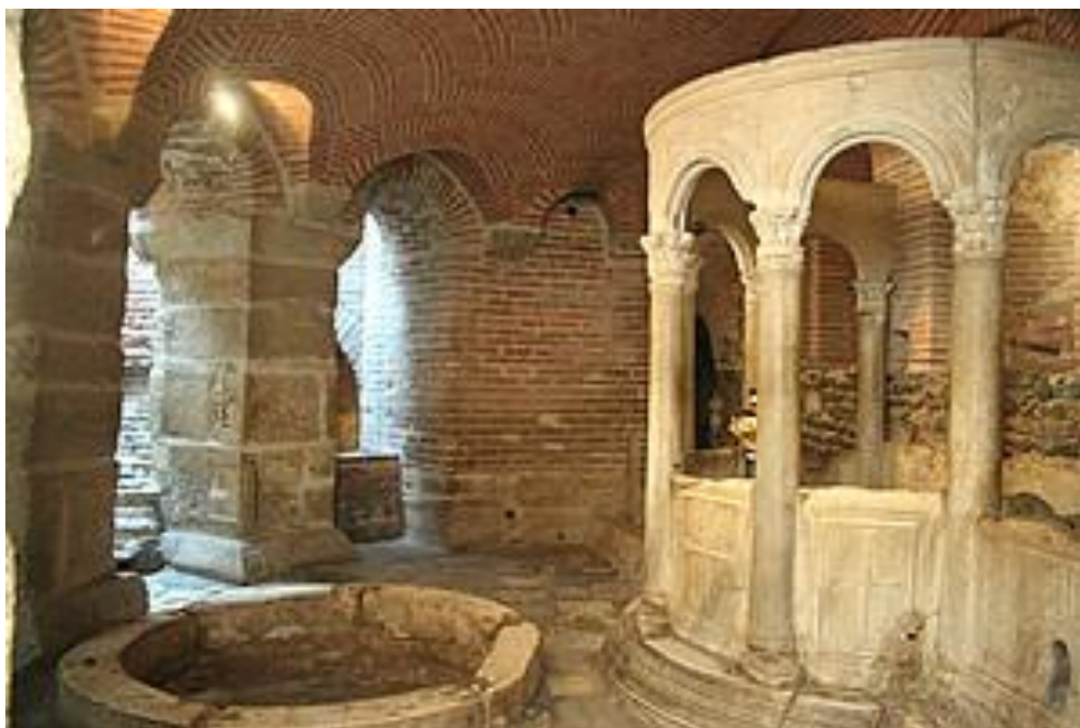
Podzemní krypta a místo mučednického skonu sv. Dimitria

Ve svém pochvalném slově, které při příležitosti svátku sv. Dimitria sestavil další věhlasný světec naší Církve, sv. Řehoř Palama, je uvedena zmínka o tom, že svatý Dimitrios se stal prostřednictvím svých svatých ctností, které ho zdobily, ve všem napodobitelem našeho Pána (Ježíše) Krista . Jmenujme jeho lásku, pokoru, čistotu, ryzost, ale i jeho tělesné a duševní panictví.“