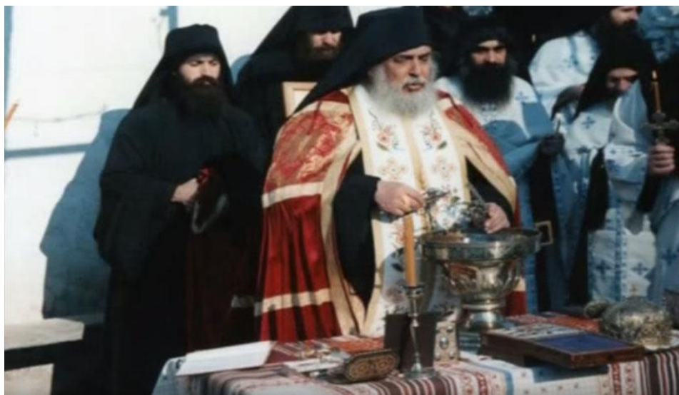
Svátek Narození Přesvaté Bohorodice (8./21.9.)